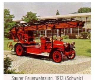
Saurer Feuerwehrauto, 1913 (Schweiz)