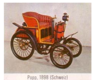
Popp, 1898 (Schweiz)