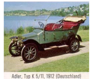
Adler, Typ K 5/11, 1912 (Deutschland)