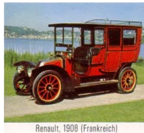
Renault, 1908 (Frankreich)