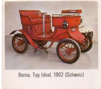
Berna, Typ Ideal, 1902 (Schweiz)