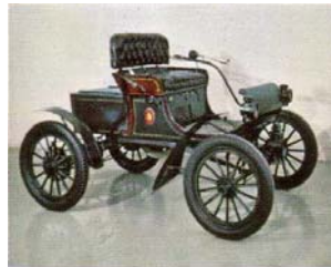
Oldsmobile, Typ Curved dash, 1903 (USA)