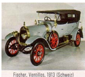
Fischer, Ventilios, 1913 (Schweiz)