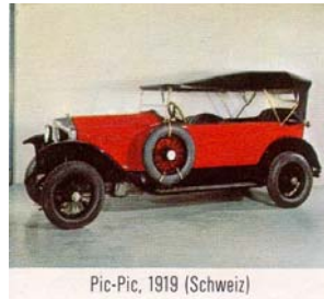
Pic-Pic, 1919 (Schweiz)