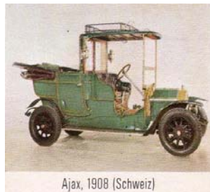
Ajax, 1908 (Schweiz)