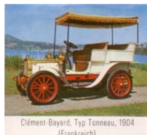
Clément-Bayard, Typ Tonneau, 1904 (Frankreich)