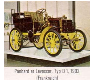
Panhard et Levassor, Typ B 1, 1902 (Frankreich)