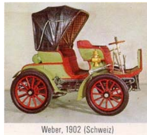
Weber, 1902 (Schweiz)