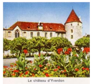
Le château d'Yverdon