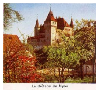
Le château de Nyon