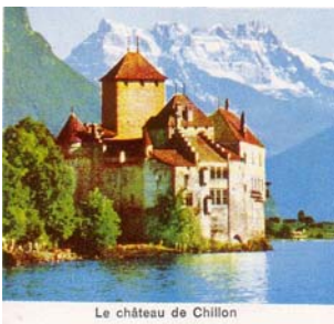
Le château de Chillon