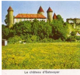
Le château d'Estavayer