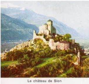
Le château de Sion