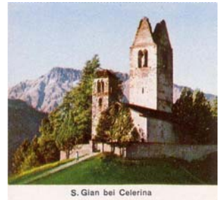
S. Gian bei Celerina