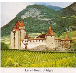
Le château d'Aigle

Festung Aarburg AG Im 11. Jahrhundert von den Grafen von Frohburg gegründet. Forteresse d'Aarburg AG Fondé au XIe siècle par les comtes de Frohburg.