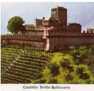
Castello Svitto Bellinzona