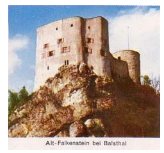
Alt-Falkenstein bei Balsthal