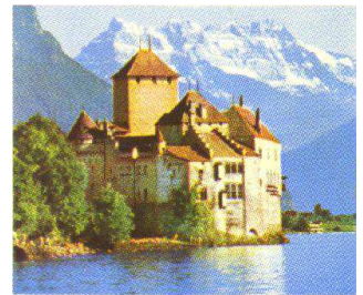
Le château de Chillon