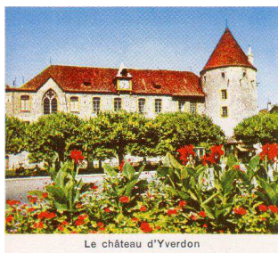
Le château d'Yverdon