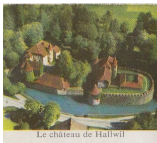
Le château de Hallwil