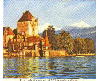
Le château d'Oberhofen