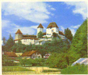
Le château de Berthoud

La bière a peu d'alcool - elle est bonne et fait du bien