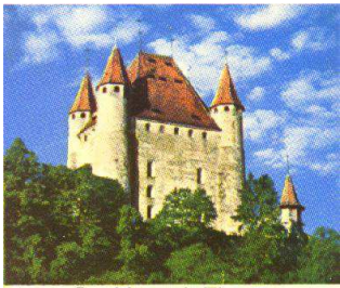
Le château de Thoune