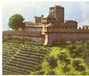
Castello Svitto Bellinzona