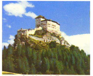
Le château de Tarasp