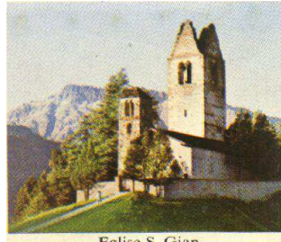
Eglise S. Gian