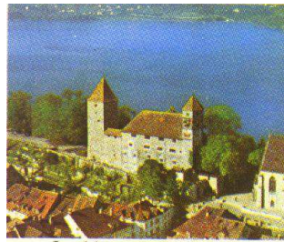
Le château de Rapperswil