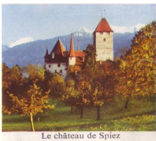
Le château de Spiez