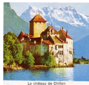
Le château de Chillon